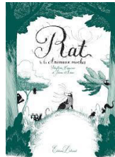
Rat et les animaux moches