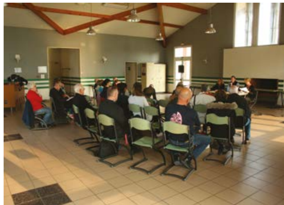
Le projet de participation citoyenne présenté en réunion publique le 11 avril 2019

« Oui. Et je peux donner un exemple récent. Mi novembre 2019, la policière municipale de Parempuyre a trouvé deux scooters sur la voie publique. Leur apparence lui a semblé bizarre. Elle nous a appelés pour nous faire part de la situation. Après une rapide enquête, il s'est avéré que ces deux véhicules avaient en effet été volés. Nous en avons informé la policière et nous avons aussitôt envoyé un garagiste agréé pour enlever les scooters de la voie publique. Sans convention, nous n'aurions pas été autorisés à partager cette information avec elle. »