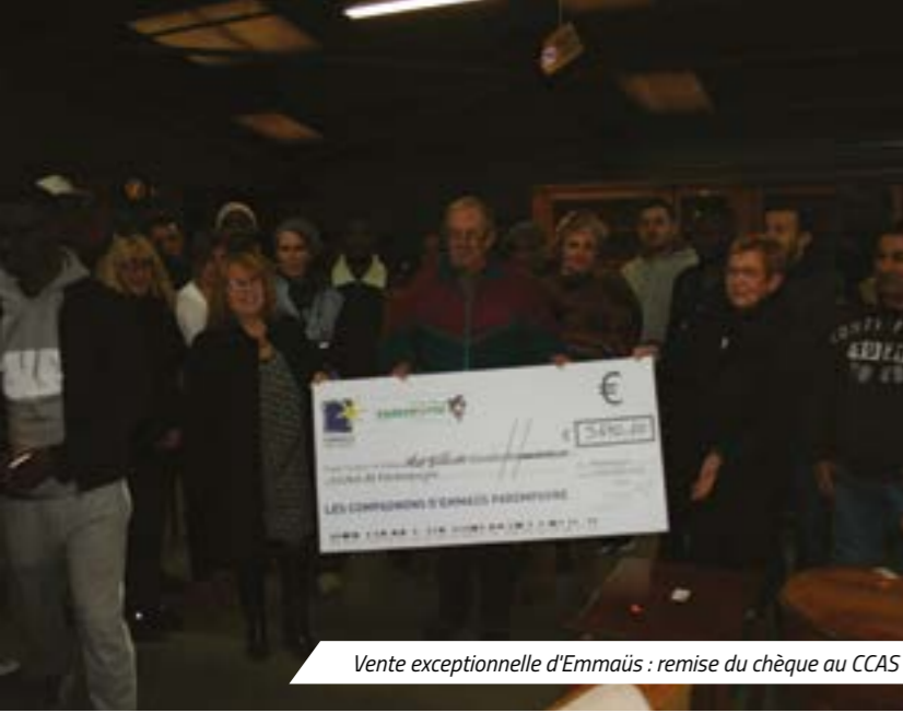
Vente exceptionnelle d'Emmaüs : remise du chèque au CCAS