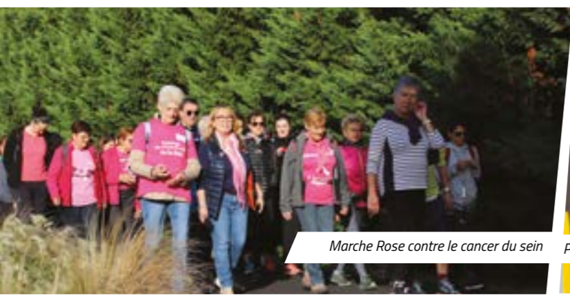
Marche Rose contre le cancer du sein