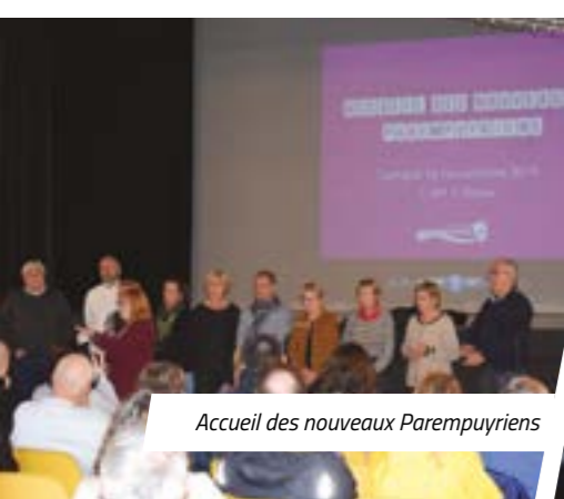
Accueil des nouveaux Parempuyriens