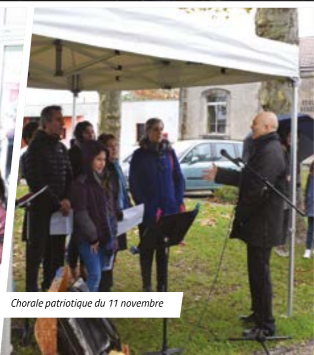
Chorale patriotique du 11 novembre