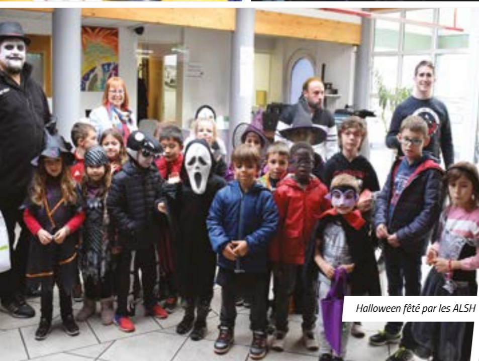
Halloween fêté par les ALSH