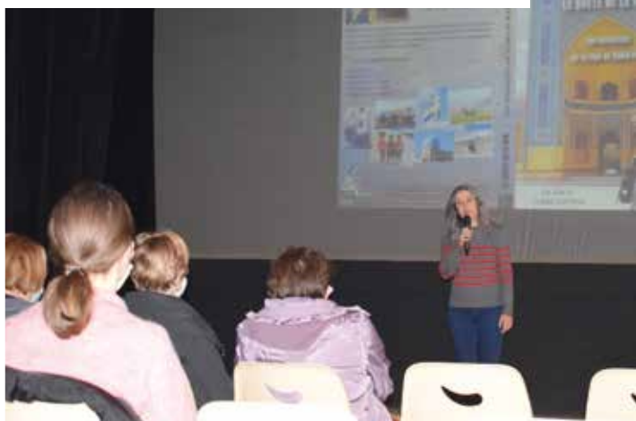
Connaissance du monde... sur la route de la soie - 28 janvier 2022