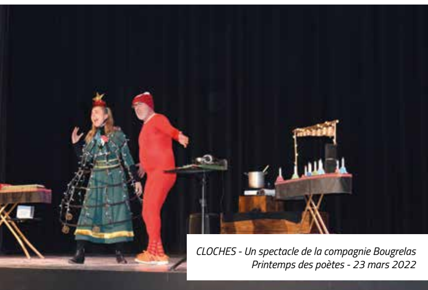
CLOCHES - Un spectacle de la compagnie Bougrelas Printemps des poètes - 23 mars 2022