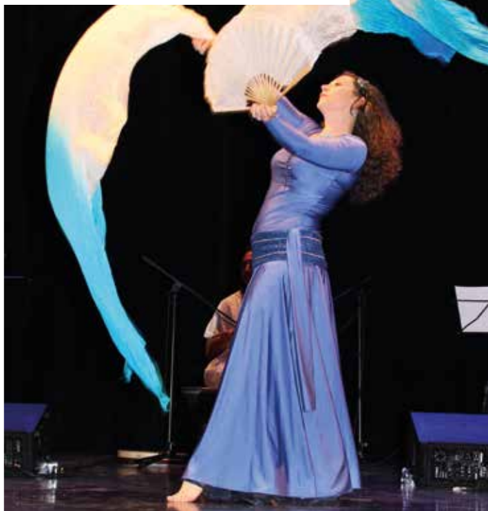
Repas spectacle - Regard sur le monde - 20 mars 2022