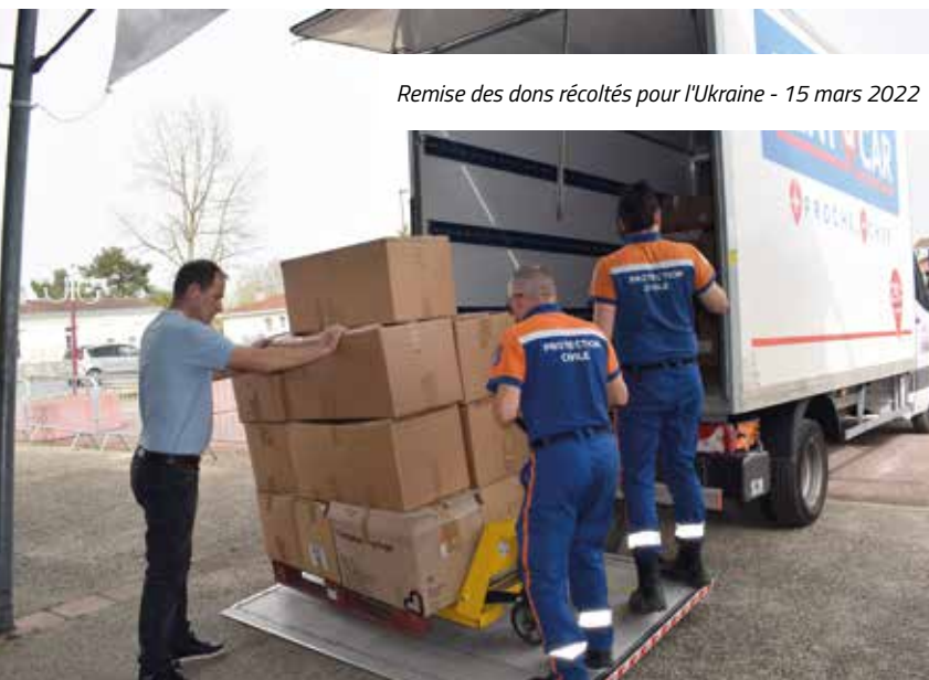
Remise des dons récoltés pour l'Ukraine - 15 mars 2022