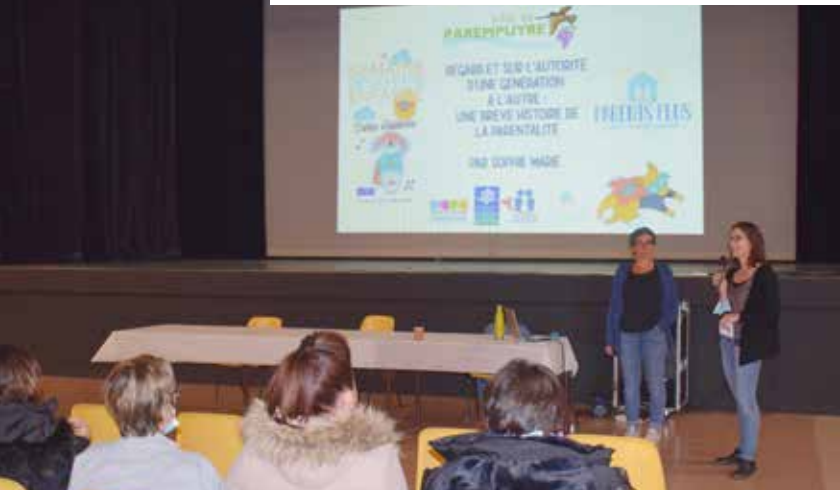
Semaine de la Petite Enfance - conférence Regard sur l'éducation et l'autorité d'une génération à l'autre - 21 octobre 2021