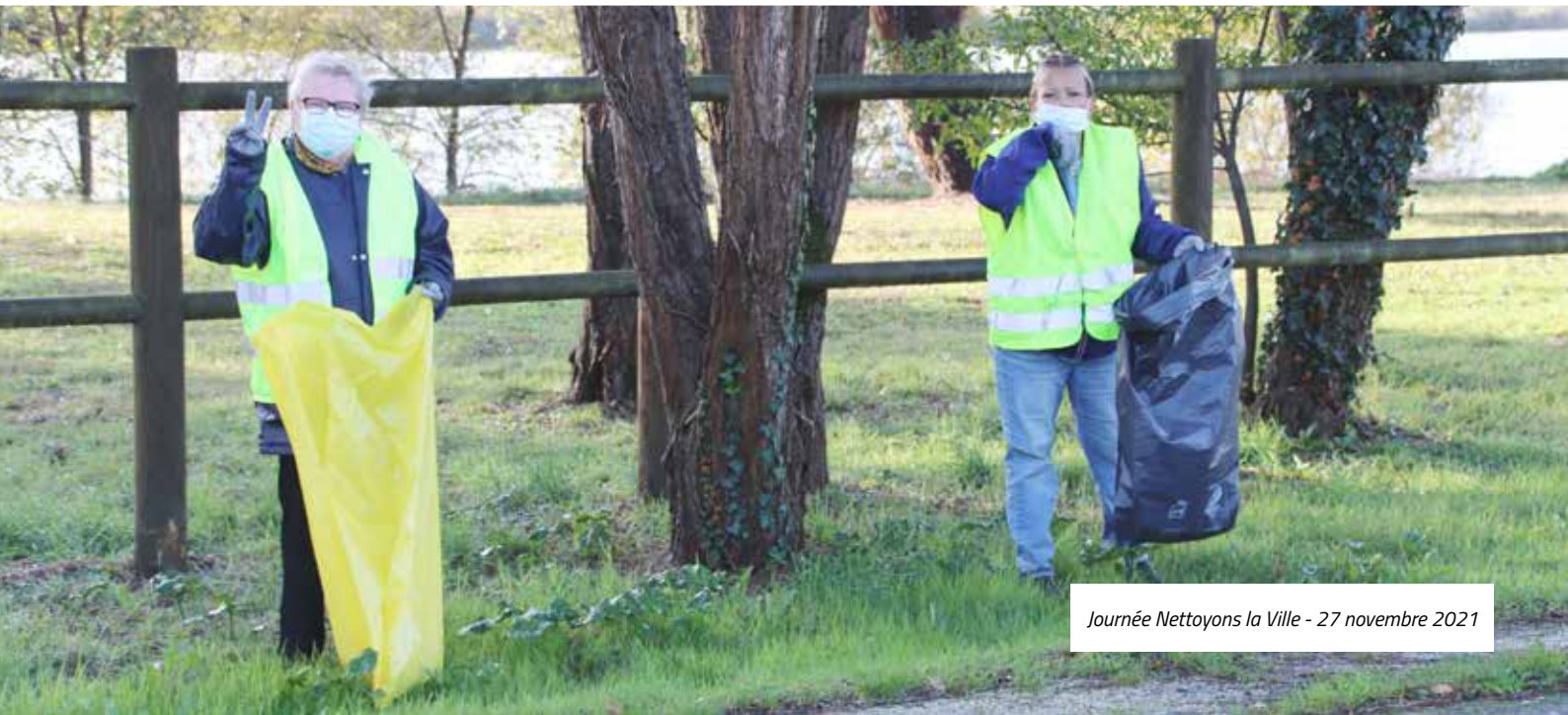
Journée Nettoyons la Ville - 27 novembre 2021