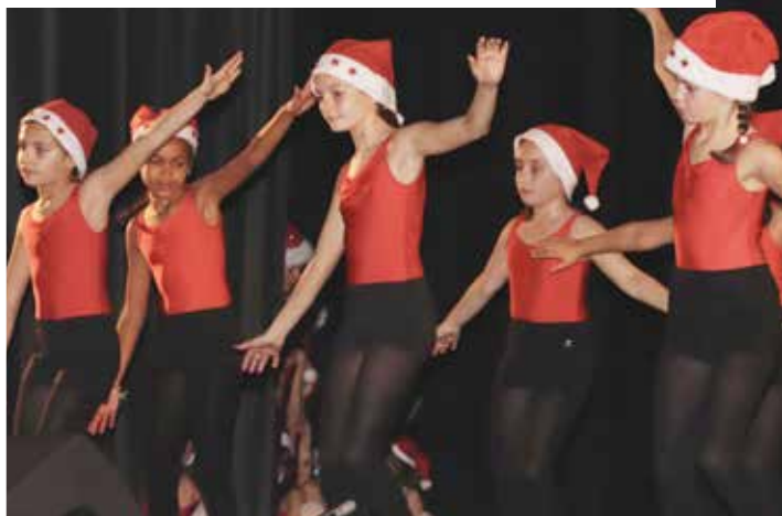
Les jeunes de l'EMA participent à la Fête des lumières - 3 décembre 2021