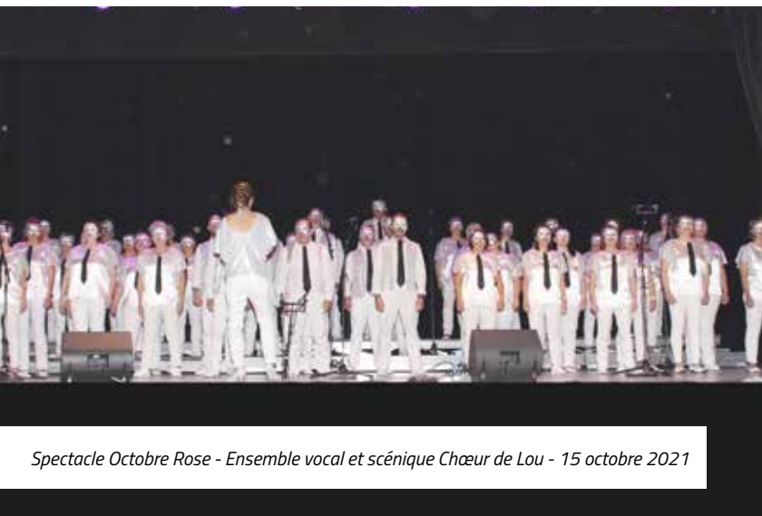
Spectacle Octobre Rose - Ensemble vocal et scénique Chœur de Lou - 15 octobre 2021