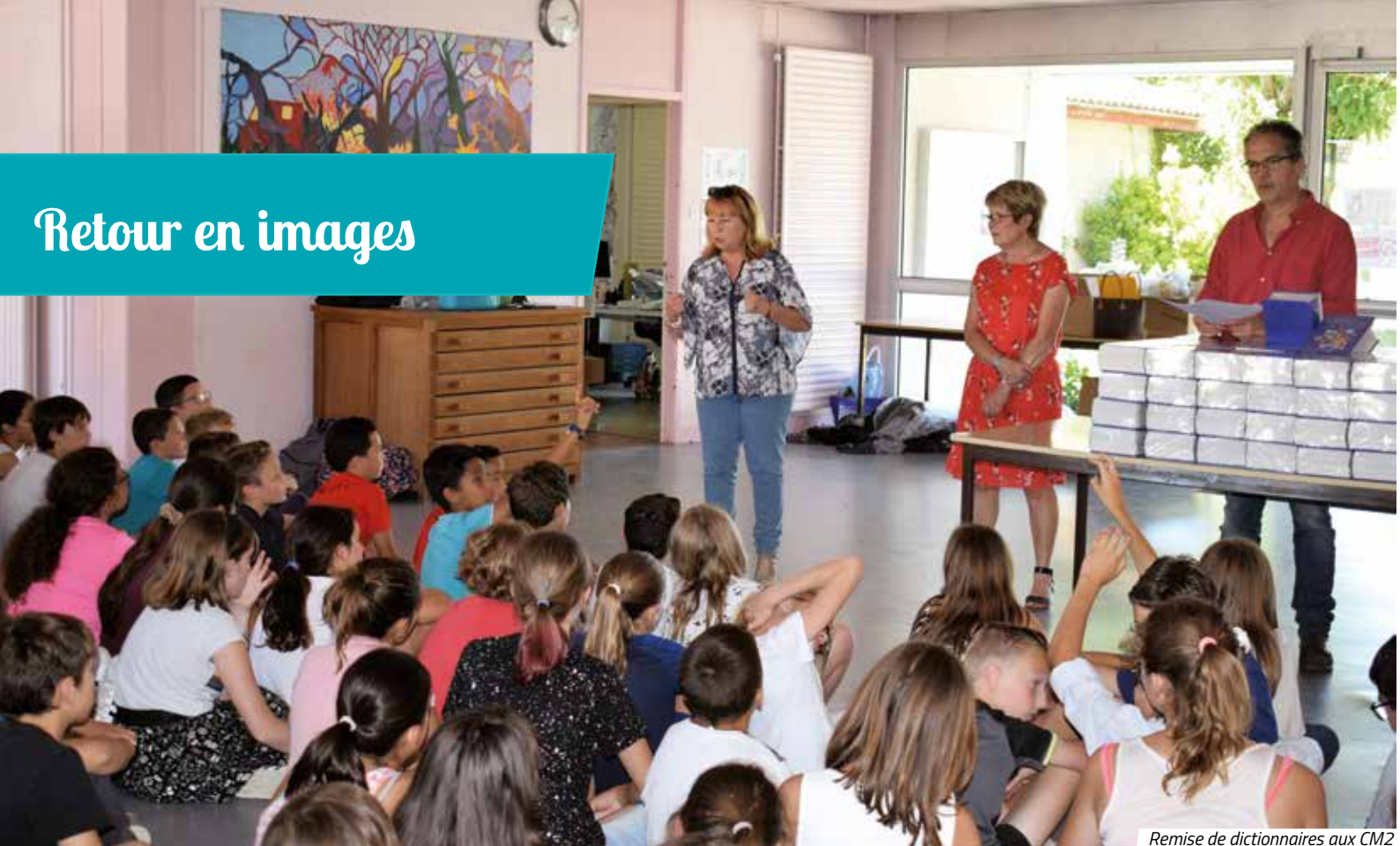
Remise de dictionnaires aux CM2