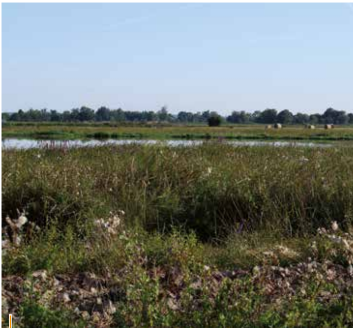
Le site d'Olives

Situé au bout de la rue d'Olives, le site est une zone humide dégradée par presque 30 ans de maïsiculture intensive. En lien avec Bordeaux Métropole, la Ville restaure ces prairies humides.