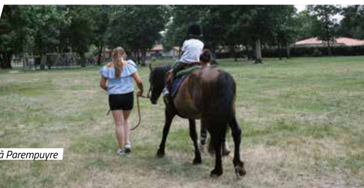
La ferme à Parempuyre