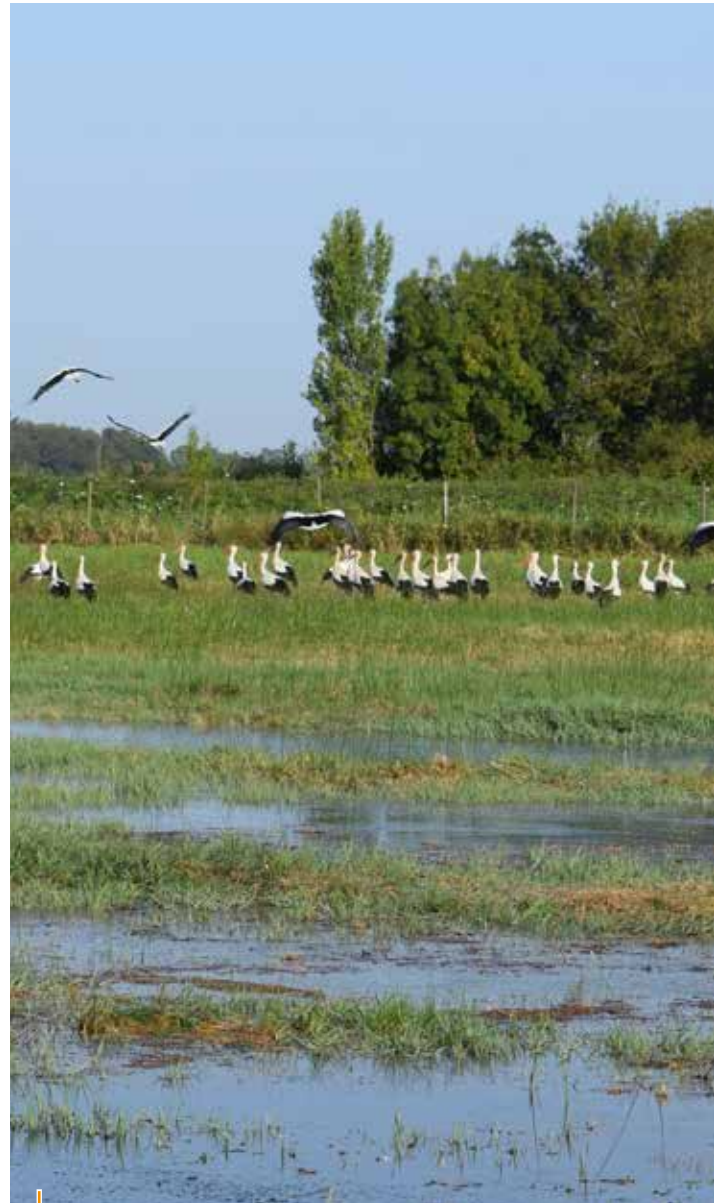
De nombreuses cygnes ont élu domicile cet été dans les marais.

La fauche raisonnée est également pratiquée sur la commune depuis 2010. Cette pratique consiste à reculer la date de tonte des pelouses ou des talus après l'arrivée à terme d'une végétation composée de graminées et de fleurs. Cela représente une niche écologique pour tout un monde, composé d'insectes et de petits animaux. Ces espaces font cruellement défaut en milieu urbain et provoquent un appauvrissement, voire une disparition de certaines espèces végétales ou animales. La fauche raisonnée favorise le retour de la biodiversité. Elle respecte le cycle de reproduction de la prairie, facilite la reconstruction de la chaîne alimentaire et respecte l'équilibre naturel du sol. Elle permet aussi de réduire le bilan carbone de la commune avec une diminution de la fréquence d'utilisation des engins de tonte motorisés et du transport de déchets verts. Vous pourrez ainsi constater que certains lieux dans la ville sont gérés en fauche raisonnée. C'est une volonté, non un oubli !