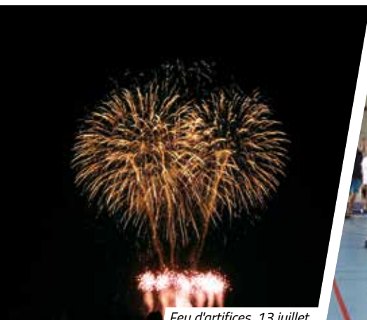
Feu d'artifices, 13 juillet