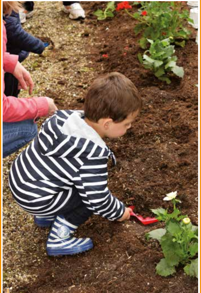
Plantations au Vieux Logis

La Ville, en lien avec le Relais d'Assistantes Maternelles et les centres de loisirs, propose des ateliers « espaces verts ». Les enfants du RAM participent régulièrement au fleurissement de la ville (plantations) tandis que les enfants des centres de loisirs ont participé cette année à la décoration de structure que vous avez pu voir notamment au parc du Vieux Logis. Le multi-accueil propose des activités similaires en partenariat avec les Jardins du Lauga.