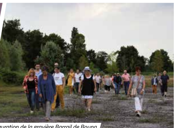
Inauguration de la gravière Barrail de Bouna